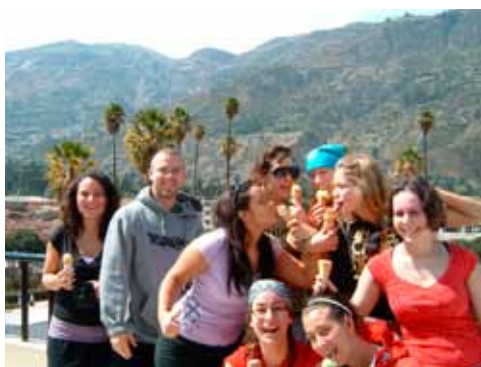
Les étudiants en Sciences humaines lors de leur stage au Pérou réalisé en décembre 2008.